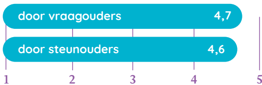
Waardering contact met de coördinatoren

Vraagouders zeggen: 'Dit zou in iedere gemeente vanaf de geboorte het verschil kunnen maken.' – 'De blije gezichtjes van mijn kinderen vind ik meer dan gewoon leuk.' – 'Dankbaar hoe ze mijn kinderen met open hart ontvangen.' – 'Een veilige en prettige omgeving voor mijn dochter.' – 'Mijn kind komt altijd ontspannen en vrolijk terug.' – 'Ze tellen de dagen tot ze weer naar steunouder mogen.' – 'Betrokken, discrete mensen.' – 'Als we een rondje gaan fietsen dan willen ze graag langs de steunouder fietsen om even te zwaaien.' – 'Mijn zoon draait gewoon lekker mee in het andere gezin. Niks geks, lekker kneuterig. Zonder dat hij ondergesneeuwd wordt door zijn eigen zusje en broertje.' – 'Onze dochter kan het echt heel goed vinden met de dochter van de steunouder. Ik vind dat mooi om te zien.' – 'Duidelijke heldere afspraken, goed overleg, meedenkend met ons.'